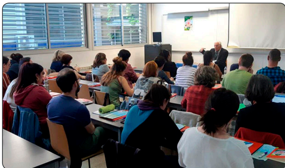
Jornadas de Aproximación a la mediación intercultural: Ámbitos de intervención con población gitana en exclusión: Jerez de la Frontera

comportamientos y actitudes de los gitanos y el origen cultural e identitario de los mismos, con el fin de abordar las diferentes problemáticas que puedan surgir en contextos desfavorecidos entre esta comunidad en situación de vulnerabilidad y el resto de la población.