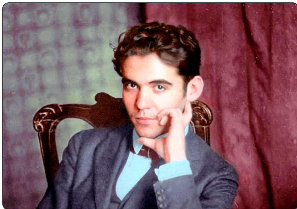
Federico García Lorca

Comentamos la efeméride del 90 cumpleaños de la publicación de esta obra de Federico García Lorca y recordamos algunos de los aspectos más importantes tanto del libro 'El Romancero Gitano' como de su, lamentablemente, corta vida.