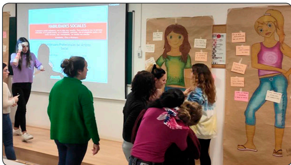
Las jornadas fomentan la participación de los asistentes con diversas dinámicas