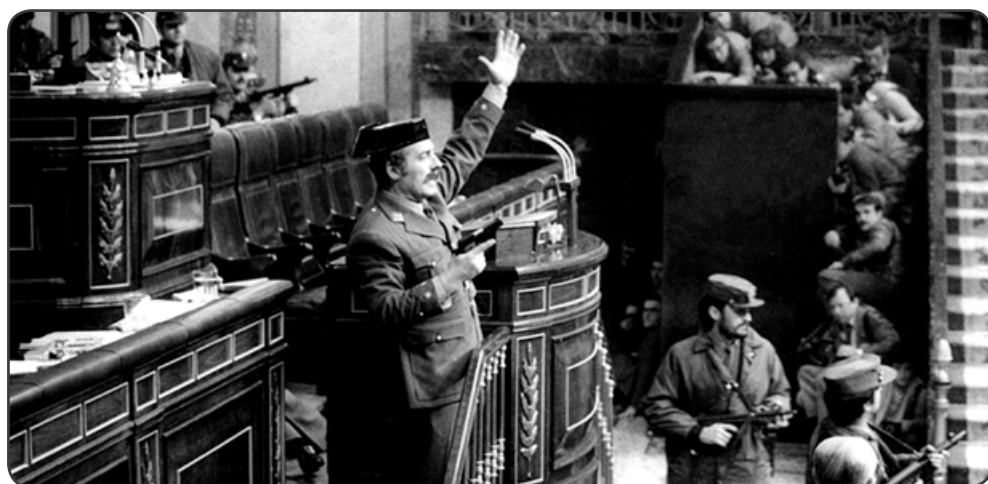
El momento en que Tejero disparó al cielo y mandó a todos los diputados al suelo