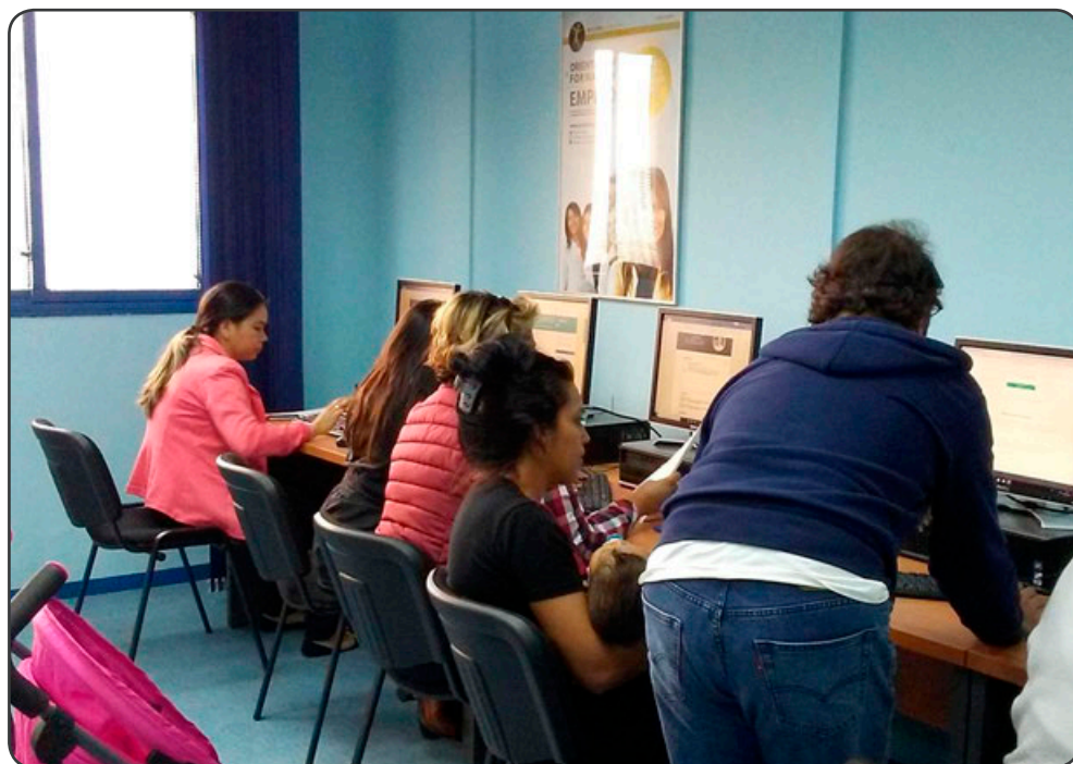
Talleres informativos que promuevan la continuidad en el sistema educativo

Hemos desarrollado talleres ocupacionales por considerarlos una herramienta formativa imprescindible