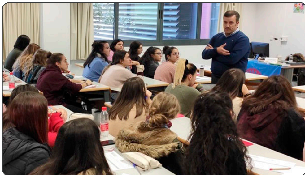
Jornadas Igualdad de Trato y No Discriminación en la Comunidad Gitana en Exclusión, en Sevilla

Haciéndose prioritario establecer un sistema que facilite el intercambio de experiencias institucionales y profesionales sobre el modelo de intervención en contextos de exclusión social, de manera, que la comunidad gitana vulnerable pueda acceder a los recursos y servicios disponibles en igualdad de condiciones facilitando así su inclusión social.