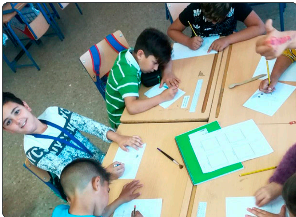
Un taller de refuerzo educativo donde se enseñan técnicas de estudio para mejorar los resultados académicos