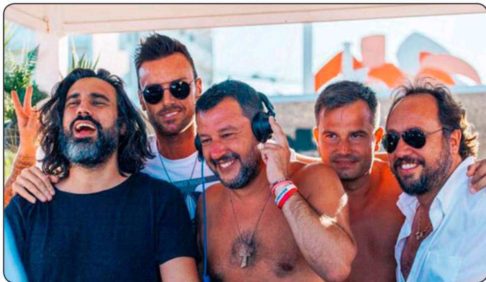
Matteo Salvini, el pasado 3 de agosto, de vacaciones en localidad de Milano Marittima, a orillas del Adriático, en la provincia de Rávena.