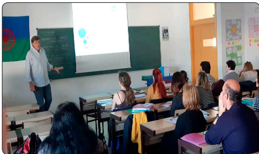
Una de las jornadas sobre la Realidad Educativa con la Comunidad Gitana

Por ello, desde Unión Romaní, consideramos prioritario el desarrollo de acciones que complementen la formación de los profesionales que desarrollan su labor con la comunidad gitana y "gadyé" en riesgo de exclusión, a través de las Jornadas de Realidad Educativa en la Comunidad Gitana en Exclusión: Formación para profesionales en el ámbito escolar, en las que mediante la realización de ponencias y talleres prácticos se abordaron contenidos como Cultura Gitana, Propuestas de Intervención, Mediación Educativa y Habilidades Sociales.