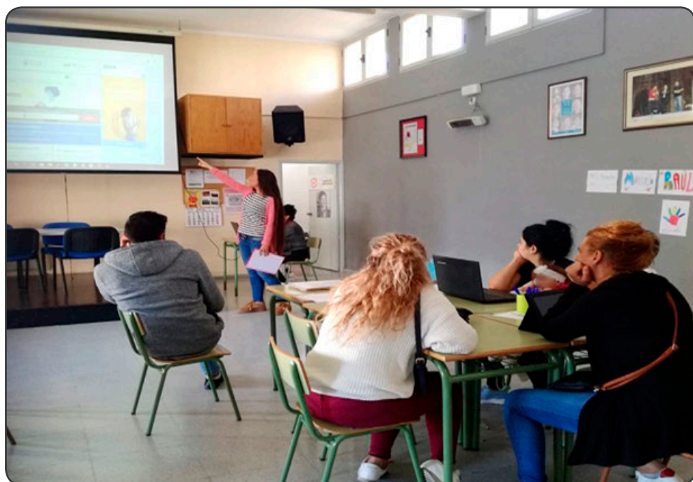
Los talleres pre-laborales de iniciación profesional son muy útiles para los usuarios

En definitiva, la formación ha sido sin duda el eje prioritario de acción de este proyecto. Dotándoles de las herramientas necesarias destinadas a promover la adquisición de hábitos, habilidades y competencias que faciliten su proceso de inserción socio-laboral y, por tanto, la mejora en la calidad de vida del grupo poblacional objeto de intervención.