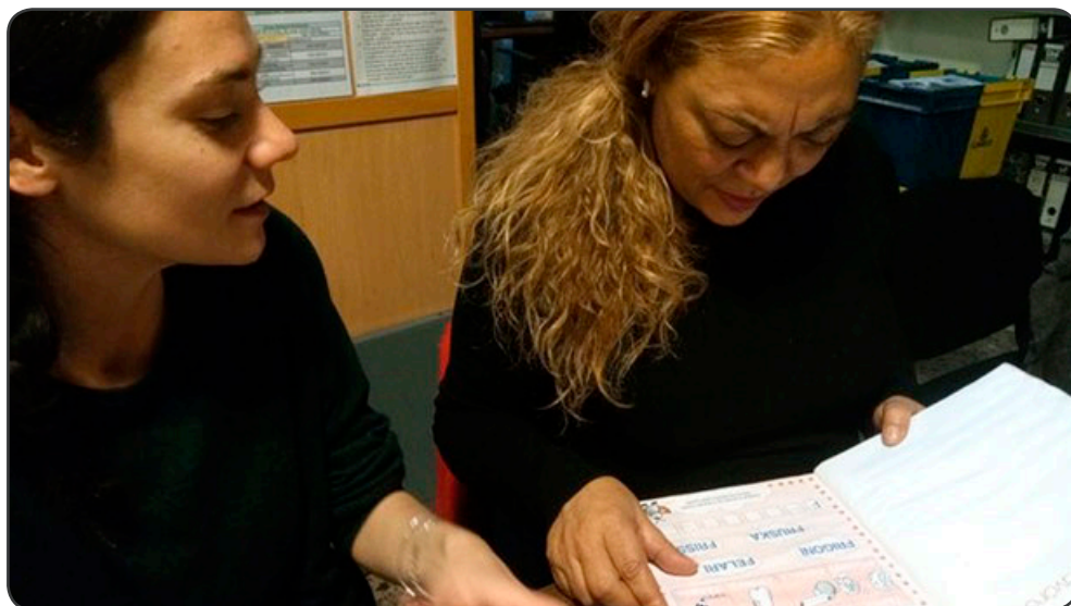
Dos de las participantes del proyecto consultando las notas y los esquemas del nuevo archivo