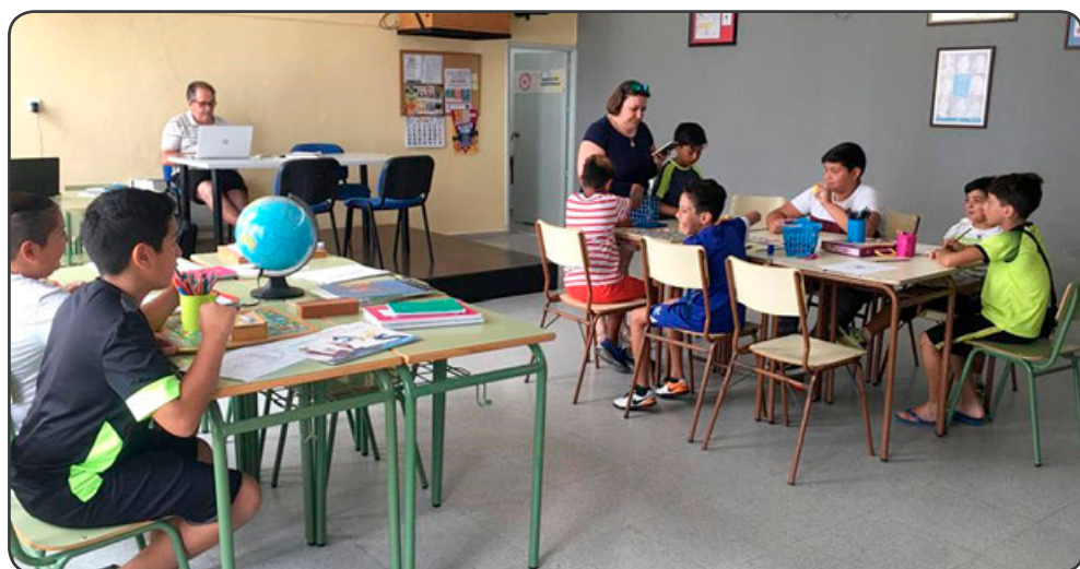
Uno de los talleres de refuerzo educativo que se realizan en las escuelas

marginación. Todo esto marca la línea de acción de la entidad para la consecución de sus fines sociales.