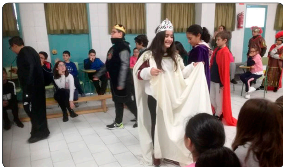
Las representaciones teatrales ayudan en el autoestima de los más jóvenes

De esta manera, no han sido solo destinatarios de las diferentes acciones, sino que se han convertido en partícipes en el diseño y desarrollo de actividades dirigidas a su propia comunidad. Consideramos que con este tipo de acción voluntaria contribuimos a la transformación socio-laboral y educativa del grupo poblacional gitano. Durante su desarrollo, hemos procurado que este programa tenga un carácter integral para la persona voluntaria, dado que ha constado de diferentes fases, desde la etapa de acogida y formación, hasta la intervención directa con las personas destinatarias.