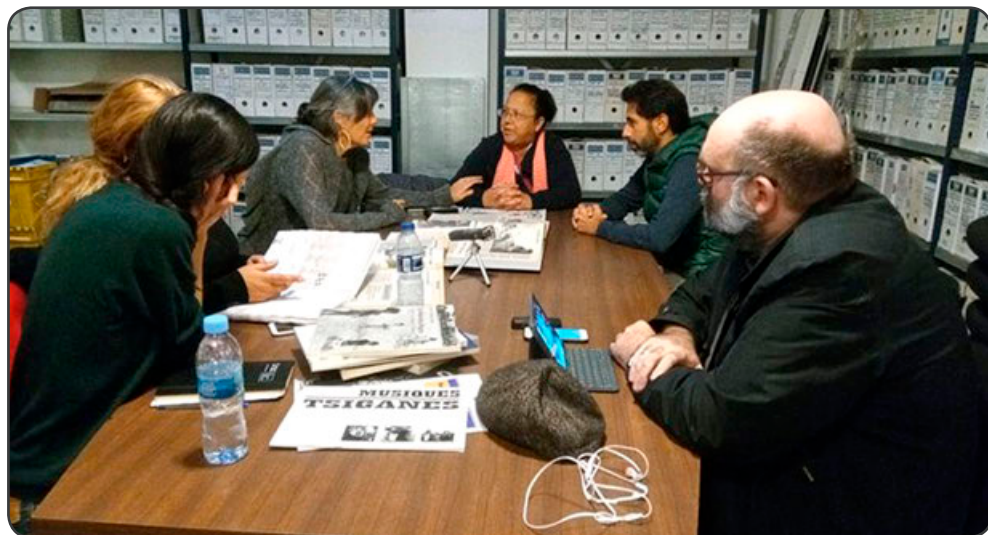
Una de las sesiones grupales para pensar el sistema más adecuado de archivo para la Unión Romaní

Para impulsar el proyecto, la Unión Romaní ha colaborado con los profesionales de “La Fundició”