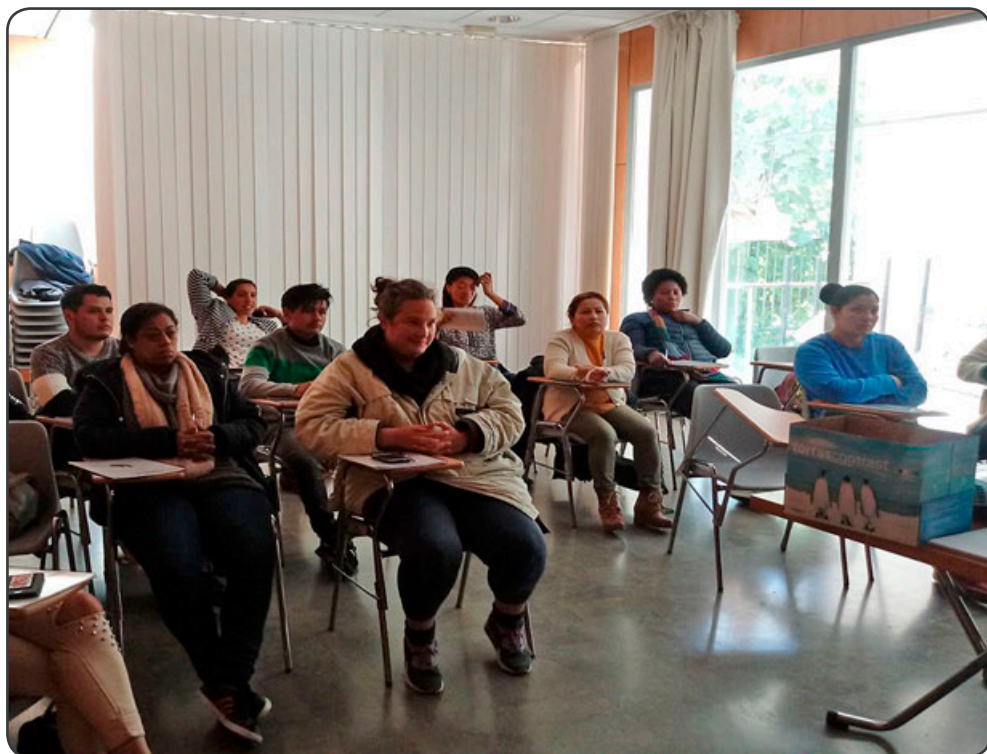
Uno de los talleres presenciales para formarse como camarera de piso